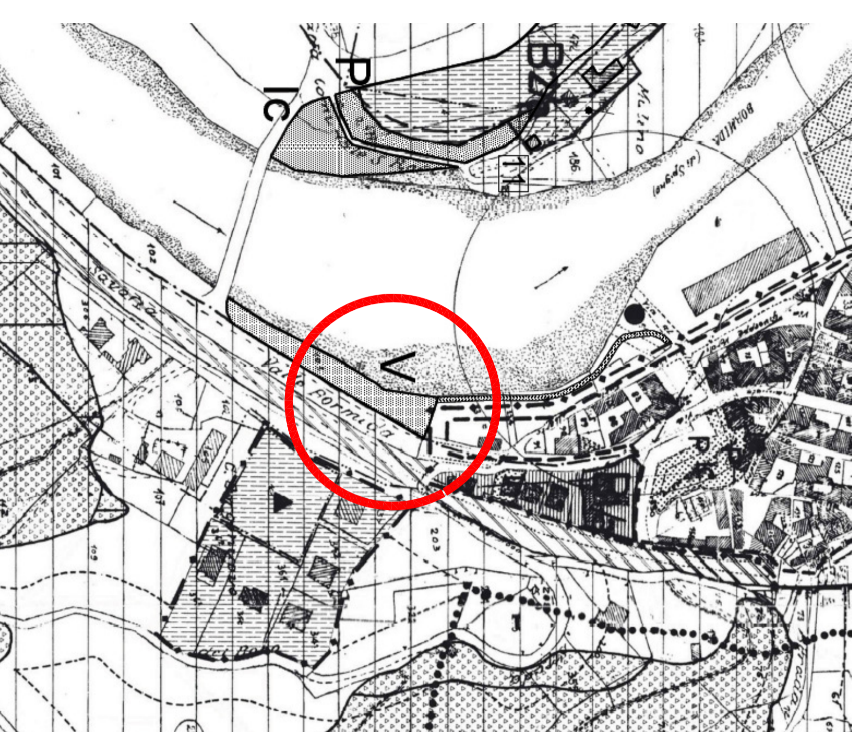
STRALCIO P.R.G.C. - scala: 1:2000